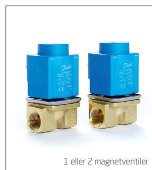
1 eller 2 magnetventiler