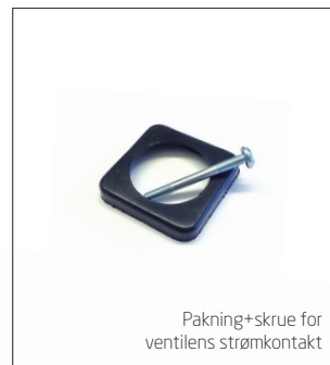
Pakning+skruer for ventilens strømkontakt